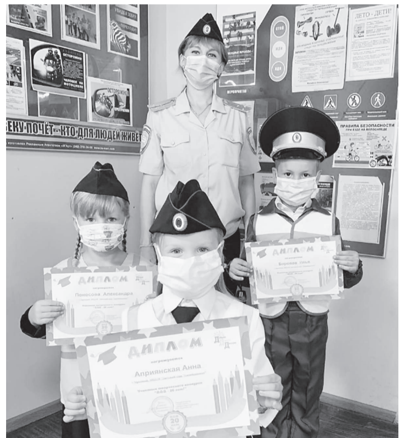
Участники Всероссийского конкурса «ДДД-20»